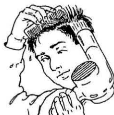
secarse el pelo