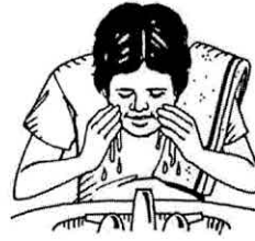
lavarse la cara