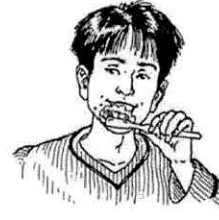
cepillarse los dientes