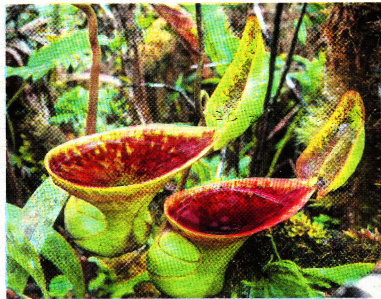
Malaysia mempunyai 14 spesies periuk kera iaitu sejenis tumbuhan karnivor yang menjadi khazanah negara.

Pada majlis tersebut, Mohamad Zabawi mengumumkan MARDI memperoleh tiga pingat emas dan satu perak da-