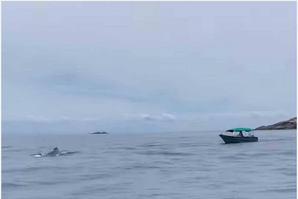
Tangkap layar video tular pada Sabtu memaparkan seekor ikan dipercayai daripada spesies paus bungkuk yang muncul di perairan Pulau Redang.

"Spesies tersebut boleh dijumpai di perairan laut dalam seluruh dunia, namun populasi paling hampir dengan perairan Malaysia adalah dari kawasan Western North Pacific.