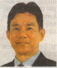
Timbalan Naib Canselor (Hal Ehwal Pelajar dan Alumni) Universiti Malaysia Terengganu (UMT)

Pelantikan profesor diraja dan profesor ulung misalnya dapat mengangkat martabat keserjanaan ahli akademik sebagai pemikir sosial menyumbang dengan melangkaui 'pagar' universiti dan rutin akademik.