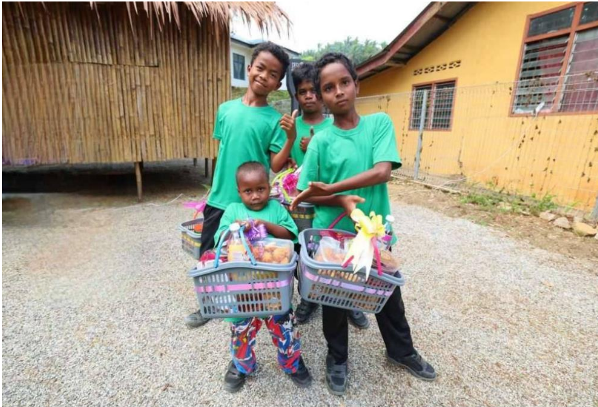
Antara anak-anak Orang Asli yang menerima bakul makanan sumbangan UMT dan agensi-agensi lain.