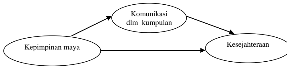
Rajah 1. Model Hipotesis

Kepimpinan maya merupakan konsep seseorang pemimpin organisasi menggunakan perantaraan komputer bagi melaksanakan fungsi kepimpinan mereka (Hinds & Kiesler, 2002). Antara fungsi kepimpinan yang dimaksudkan adalah seperti pengarah tugas, membuat keputusan dan penyelesaian masalah (Mohd Yusri et. al, 2013). Komunikasi dalam kumpulan didefinisi sebagai tingkahlaku komunikasi antara ahli organisasi seperti penghantaran dan penerimaan maklumat, membuat keputusan bersama, mengemukakan cadangan, membincangkan cadangan, mencari penyelesaian masalah, berinteraksi untuk sosial dan sebagainya. Kesejahteraan kerja pula merujuk kepada bagaimana seseorang pekerja rasa gembira, selesa, bahagia dan berpuas hati dengan kerja norma dan suasana kerja mereka.