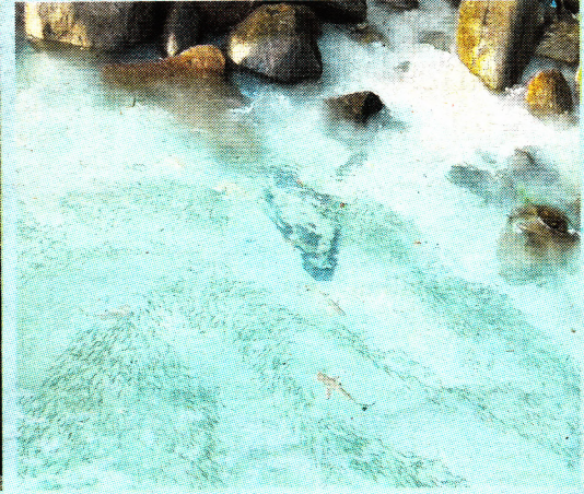
Lokasi strategik di Pulau Lang tengah bagi projek kelestarian ekosistem dan konservasi.

terjaga, sesuai untuk kegiatan rekreasi air memberikan pengalaman unik bagi yang gemarkan cabaran alam semula jadi.