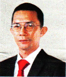
Timbalan Dekan (Bakat & Penyelidikan), Fakulti Perniagaan, Ekonomi Dan Pembangunan Sosial, Universiti Malaysia Terengganu