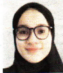
Mahasiswi Sarjana Muda Ekonomi (Sumber Alam), Universiti Malaysia Terengganu